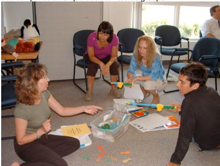
Un groupe de participants en pleine action

Le CSAP compte maintenant des programmes de francisation précoce dans huit écoles. Ce programme permet à des enfants de 4 ans de suivre un programme éducatif quotidien en français. Une session de formation organisée par le CPRPS pour les éducatrices, a eu lieu les 6 et 7 septembre 2007 à La Butte. Ces éducatrices ont pu visiter les locaux du CPRPS et du CPRP, emprunter des ressources et animer en équipe des chansons, des comptines ainsi que des activités de groupe.